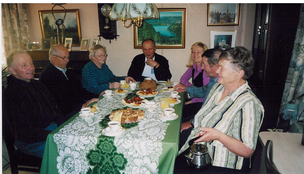
Johtokunnan kokous Särkisellä