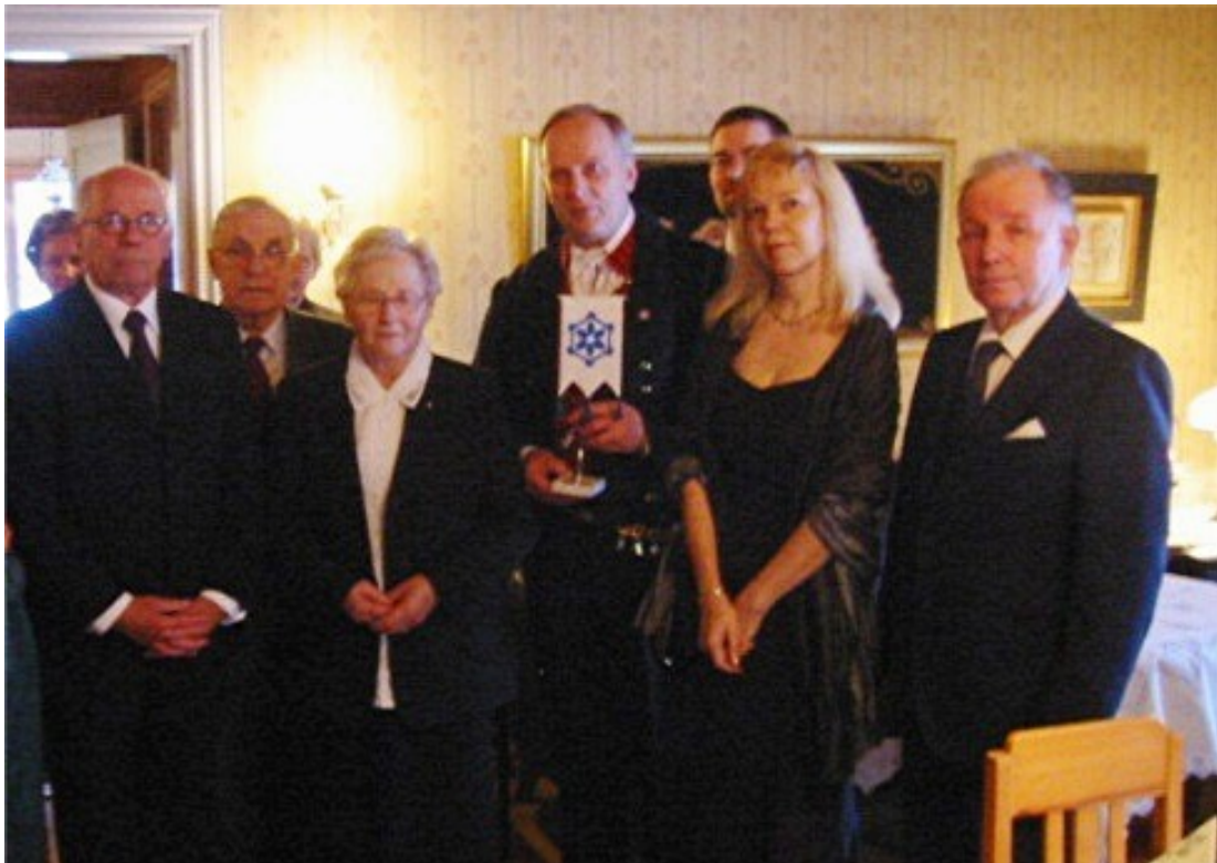
Johtokunnan jäseniä päiväsankarin ympärillä.